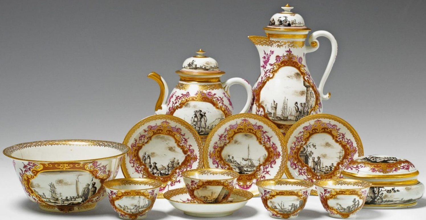
Meissen Porezellan Manufaktur 1730

כיצד הפך החומר הלבן, החרס הסיני, למושא תשוקתה של האצולה המערבית המודרנית והפוסט מודרנית?