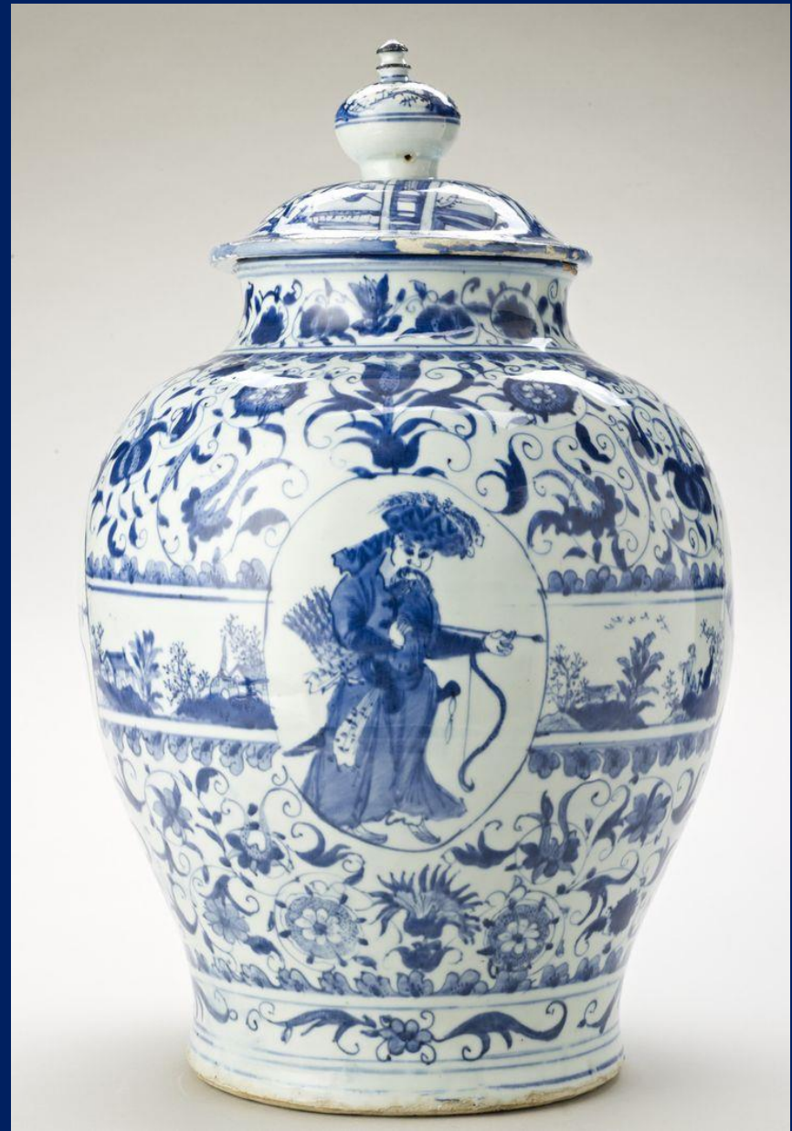
Ming Dynasty Blue and White

הפורצלן על ייצורו ועיבודו נשמר כסוד בסין למעלה מאלף וחמש מאות שנים, ורק בתחילת המאה ה-18 חלה פריצת דרך משמעותית - גילו בגרמניה את הרצפט המסתורי והחלו לייצר כלי פורצלן בעיירה מייסן.